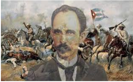
José Martí: 127 aniversario de su caída en combate.

José Julián Martí Pérez murió en Dos Ríos el 19 de mayo de 1895. Héroe Nacional de Cuba. Fue un hombre de elevados principios, vocación latinoamericana e internacionalista; intachable conducta personal, tanto pública como privada y con cualidades humanas que en ocasiones parecen insuperables. Un cubano de proyección universal que rebasó las fronteras de la época en que vivió para convertirse en el más grande pensador político hispanoamericano del siglo XIX