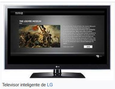
Televisor inteligente de LG

El primer televisor totalmente electrónico (sin elementos mecánicos para generación de la imagen) con tubo de rayos catódicos fue manufacturado por Telefunken en Alemania en 1934, seguido de otros fabricantes en Francia (1936), Gran Bretaña (1936) y Estados Unidos (1938). Actualmente las cámaras de televisión a bordo de las naves espaciales estadounidenses transmiten a la Tierra información espacial. Las naves espaciales Mariner, lanzadas por Estados Unidos entre 1965 y 1972, envió miles de fotografías de Marte. Desde 1960 se han venido utilizando también ampliamente las cámaras de televisión en los satélites meteorológicos en órbita. Gracias a los avances en la tecnología de pantallas, hay ahora varias clases en los televisores modernos. Hasta llegar a los televisores inteligentes.