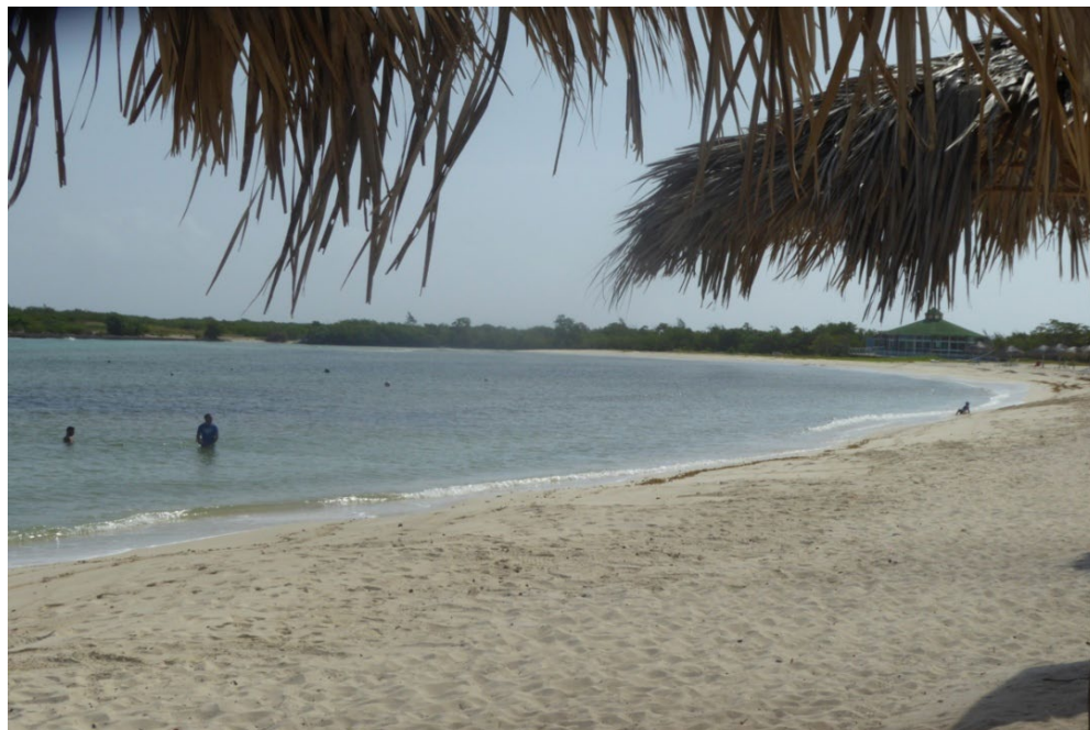
La preservación de las playas arenosas cuenta entre las prioridades de la Tarea Vida en Las Tunas.

«Lo que sucede —señaló el especialista— es que estos impactos no pueden verse de forma aislada, porque unas problemáticas llevan a otras. Por ejemplo, en Las Tunas se manifiesta el fenómeno de la intrusión salina en los acuíferos abiertos al mar, con 1 140 kilómetros cuadrados afectados, pero eso sucede por el ascenso del nivel medio del mar, que se combina con el bajo promedio de precipitaciones y