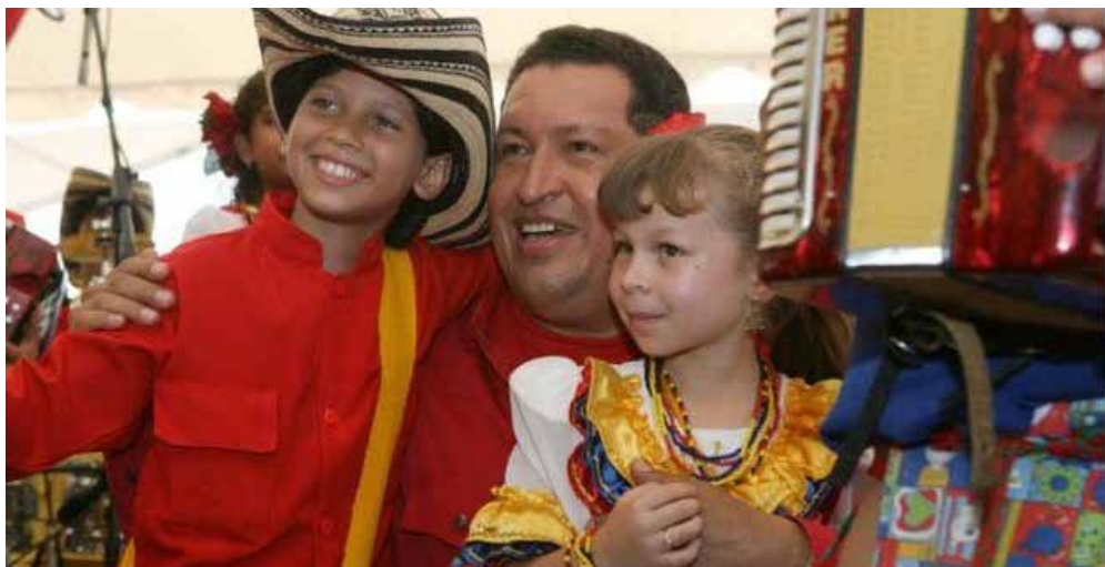
Chávez fue un fiel defensor de los derechos de los niños y las niñas.

«Recordamos 19 años de aquella primera edición televisiva del programa Aló, Presidente , espacio conducido por nuestro Comandante Chávez, que se convirtió en una escuela de formación política para el pueblo, rompiéndose con todos