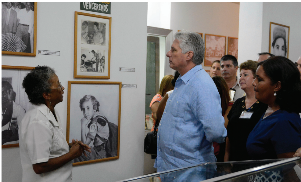
El Presidente cubano presta especial atención a la preservación del patrimonio documental e histórico de la nación cubana.

El mandatario cubano, según un reporte transmitido ayer en el Noticiero Nacional de la Televisión, destacó los resultados alcanzados en este tema y la importancia de incorporar nuevo equipamiento en esos centros en la medida de las posibilidades.