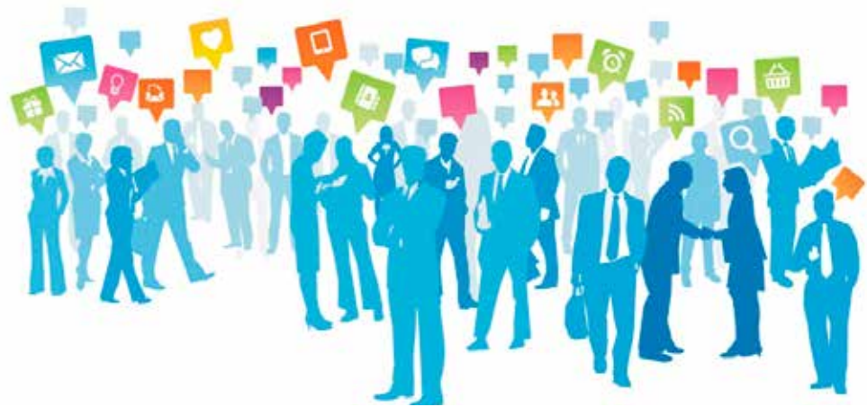
ILUSTRACIÓN: MARCA DIGITAL

Cuanto más controla la hegemonía ideológica ese oligopolio digital, y más controlan las finanzas las grandes corporaciones bancarias y las instituciones como el FMI, menos democracia hay en el mundo. Todo conspira para que aceptemos la propuesta del sistema: cambiar libertad por seguridad. Según la óptica del sistema, basta echar un vistazo alrededor para comprobar que todo respira violencia: el noticiero de televisión, las novelas y las películas; los memes de internet y los mensajes de Facebook; la delincuencia en las calles y la inseguridad permanente del ciudadano. Entonces, sugiere el mensaje subliminal, entréguese a quien se deshace de un manotazo de la tolerancia y las convenciones de derechos humanos y