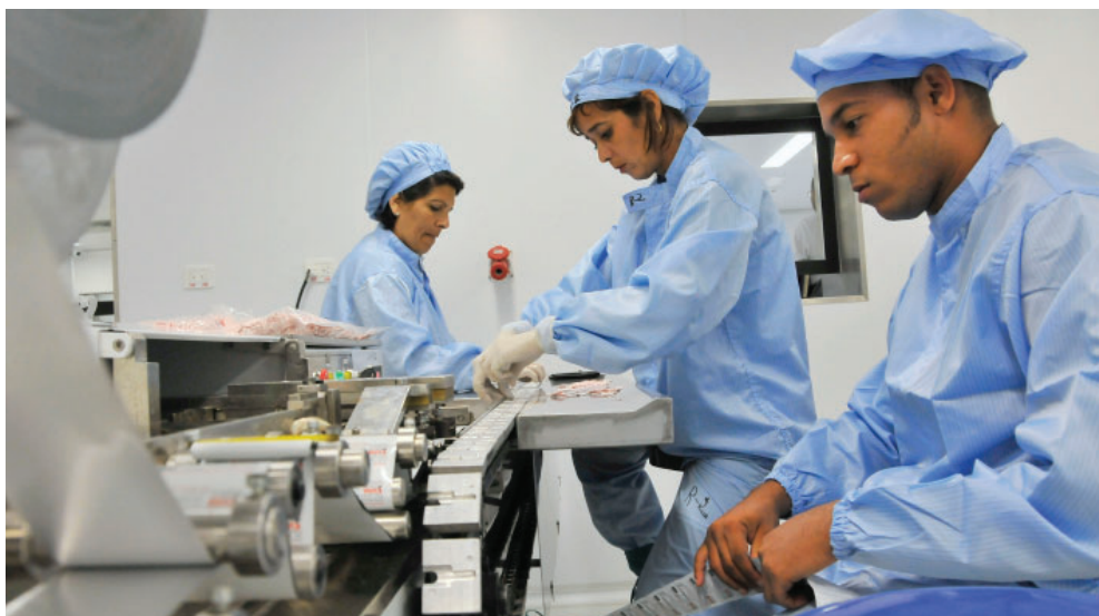
La producción de biosensores se vio afectada en los meses de febrero, abril y mayo, pero desde este último mes se han estabilizado las entregas.

Entre los medicamentos por los cuales preguntaron los internautas figuraba el clopidogrel, específicamente por su distribución en la capital del país. Sobre ello respondieron la Empresa Laboratorios MedSol y BioCubaFarma,