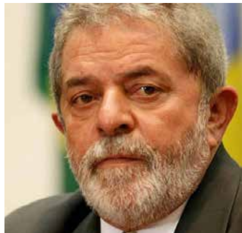
La defensa de Lula presentó un recurso de habeas corpus en el Tribunal Supremo Federal.

Los diálogos también muestran que los fiscales no estuvieron de acuerdo con la solicitud de Lula de ir al funeral de su