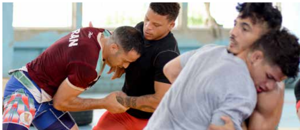
Los luchadores cubanos terminaron su preparación de cara al mundial en el Centro de Entrenamiento para Atletas de Alto Rendimiento Cerro Pelado.