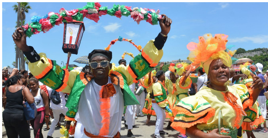
La alegría fue la protagonista del verano.

Antecedida por estas emotivas vivencias, la capital será la sede del cierre del verano, para lo cual este