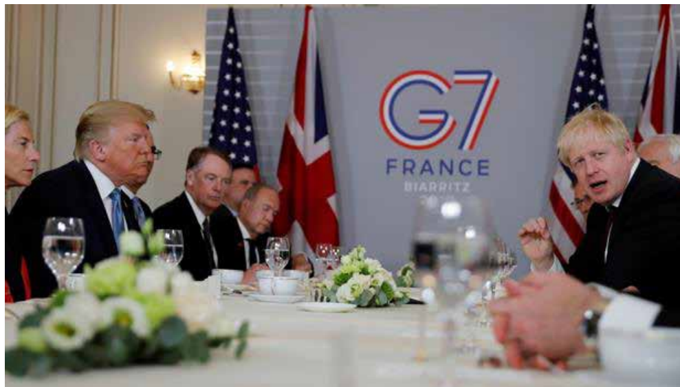
Según aclaró el medio de prensa ABC, durante los encuentros, Boris Johnson, primer ministro del Reino Unido, se negó a pagar la factura de un Brexit sin acuerdo.

Incluso, una fuente citada por Reuters dijo que «Trump estaba avisado y le dio el visto bueno», otra, de la Casa Blanca, contradujo lo anterior y aseguró que «ni estaba avisado, y por tanto no pudo aprobarla. Pero tampoco protestó».